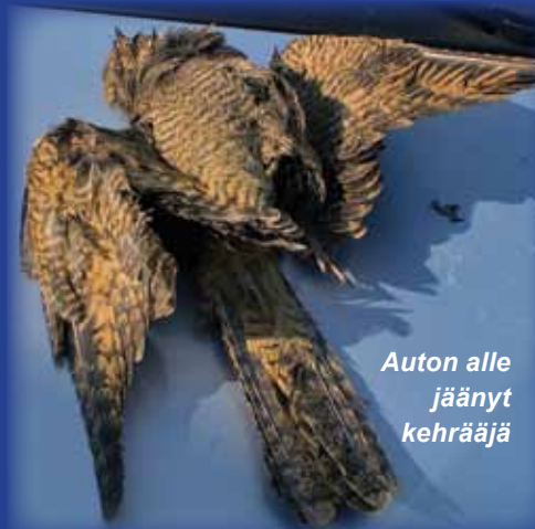
Auton alle jäänyt kehrääjä

Ja miksi tuon varpaan kynnen sivussa on merkittävä joustava, ikäänkuin muovinen "kampa"? Luulisin, että vain harva osaisi vastata tähän kysymykseen. Itse asiassa se on ollut lintuharrastajillekin ihmettelyn aihe vuosikymmeniä. Kunnes eräs suomalainen lintuharrastaja löysi tähän kysymykseen vastauksen.